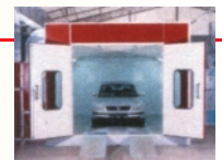
VERNICIATURA A FORNO