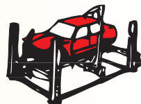
RADDRIZZATURA CON BANCO